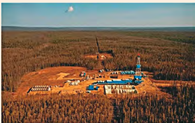
Рис. 1. Ландшафт Среднеботуобинского НГКМ

Надмерзлотные воды четвертичного горизонта сосредоточены в аллювиальных отложениях третьей и четвертой надпойменных террас, представленных песками и гравийно-галечными отложениями мощностью до 20 м. Емкостные