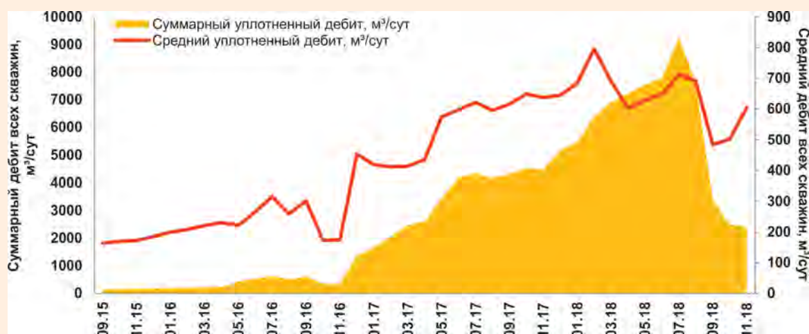
Рис. 3. Динамика добычи межмерзлотных подземных вод на Среднеботуобинском НГКМ

374–377 м. При опробовании скважин удельный дебит составил от 0,025 до 1,62 дм³/с·м, изменяясь в значительной степени.