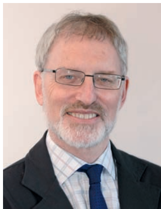
Ниэл Уэзерстоун, председатель CRIRSCO