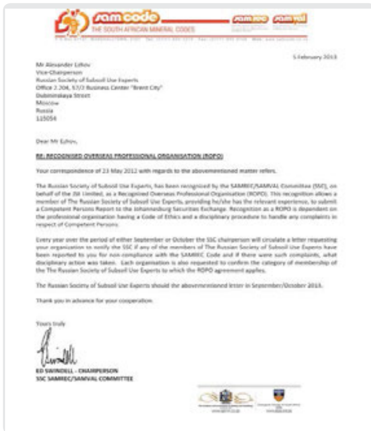
Рис. 5. The Russian Society of Subsoil Use Experts

геологи и горные инженеры могут выступать в роли Компетентных лиц в Европе и представлять отчеты на европейские фондовые биржи ( рис. 3 );