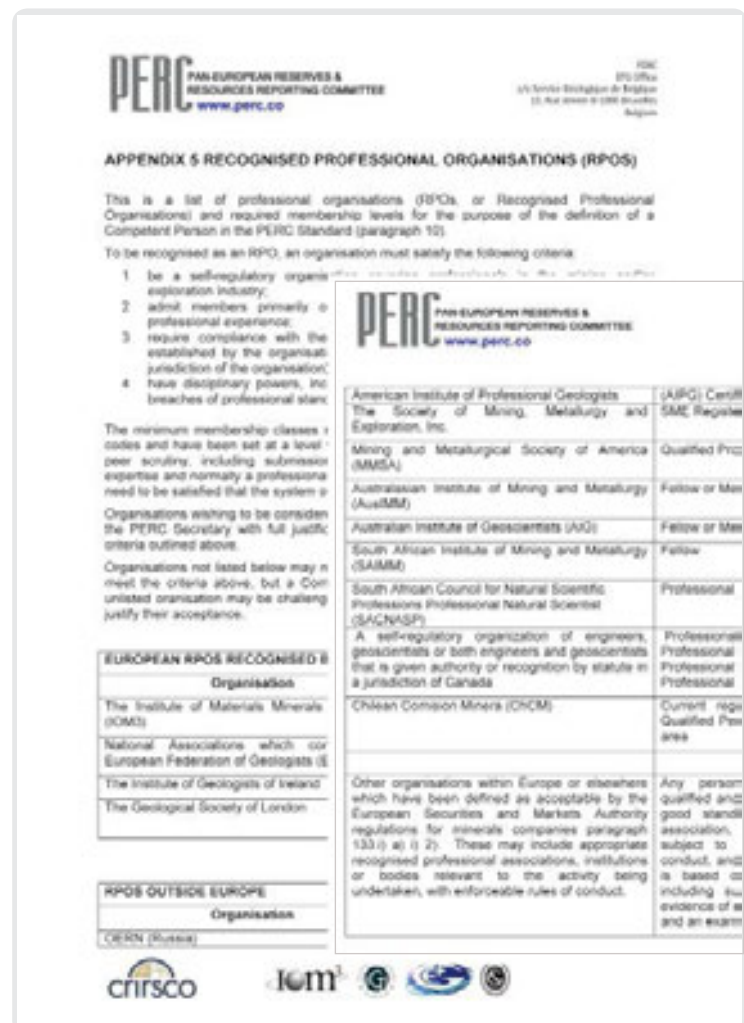
Рис. 3. PERC REPORTING STANDARD 2013 short