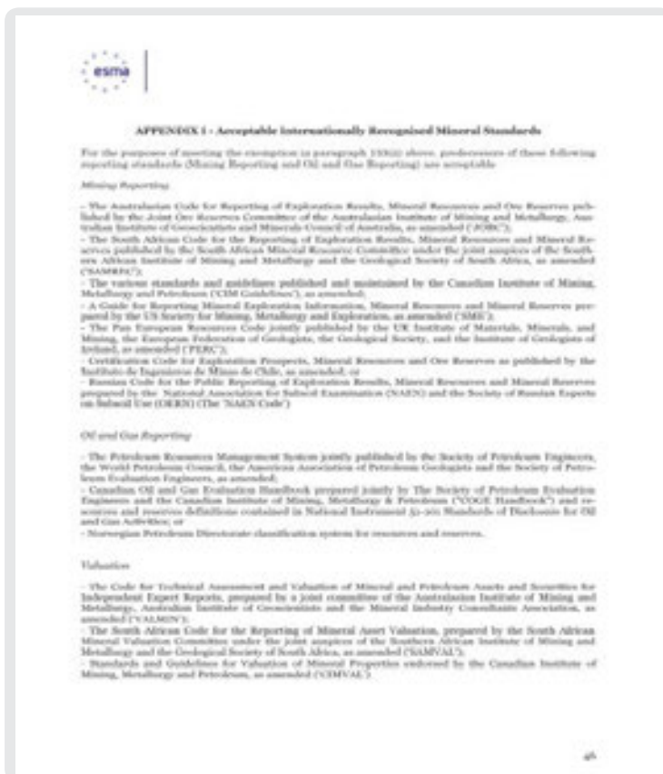
Рис. 1. ESMA

Российский кодекс предназначен, главным образом, для использования российскими компаниями – для независимой оценки их минерально-сырьевых активов и выхода на фондовые рынки, как на национальном, так и на международном уровнях. В связи с этим встает вопрос о признании Кодекса НАЭН ведущими мировыми торговыми площадками. Для этого в настоящее время ведется тесное взаимодействие с Европейским управлением по надзору за рынком ценных бумаг ( ESMA ) и