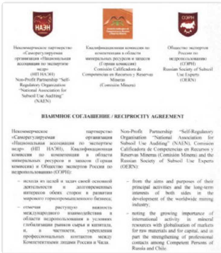
Рис. 4. Reciprocity agreement Russia-Chile