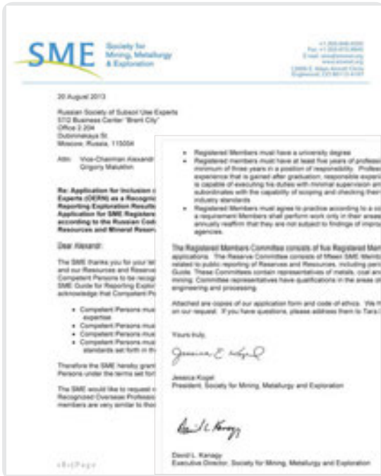
Рис. 6. OERN Letter of Reciprocity