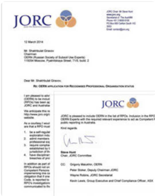
Рис. 7. OERN advice letter March 2014

Таким образом, сегодня уже созданы минимально необходимые условия для формирования «института» Компетентных лиц в России. ОЭРН полностью готово для принятия специалистов в члены, а членство позволит специалистам выступать в роли Компетентных лиц при подготовке отчетов о запасах и ресурсах полезных ископаемых в соответствии с кодексами стран, где ОЭРН признано в качестве RPO.