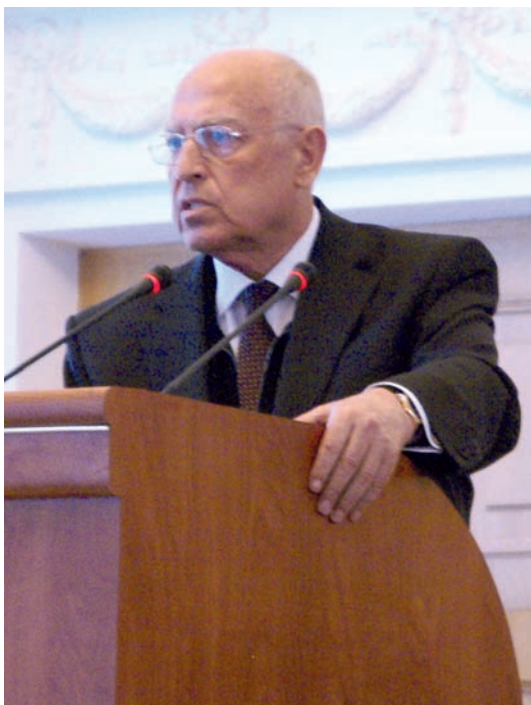
В. С. Черномырдин, министр нефтяной и газовой промышленности СССР в 1985–1989 г., Председатель Совета Министров — Правительства РФ (1992–1993), Председатель Правительства РФ (1993–1998), один из основателей НП «Горнопромышленники России»