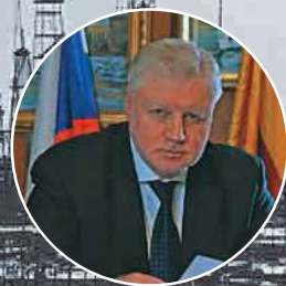
С.М. Миронов Председатель партии «Справедливая Россия»