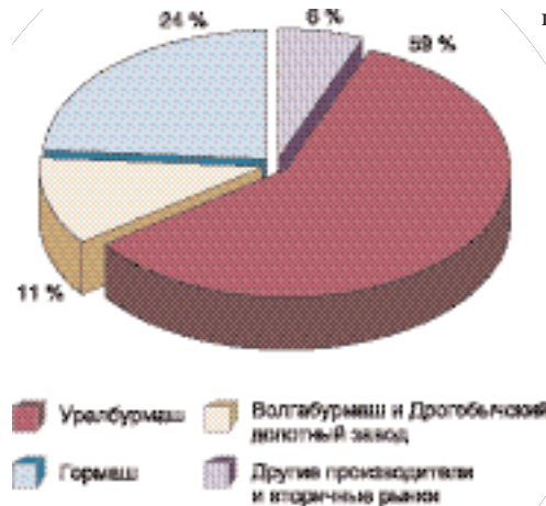
Распределение российского рынка буровых долот между основными производителями в 2006 г. (по оценкам аналитической службы ОАО «Уралбурмаш»)

привлечение и увеличение объемов инвестиций предприятиями горнопромышленного сектора в расширение собственной ресурсной базы,